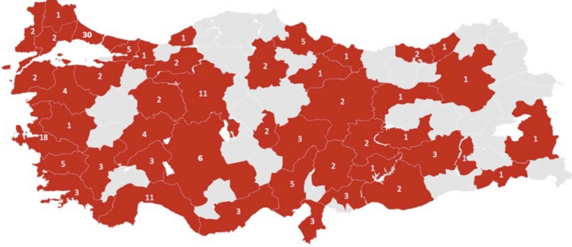
Toplam 166 Restoran

Şirketin sahip olduğu markalar “Baydöner”, “Bursa İshakbey” ve “Pide by Pide” olup, AVM ve caddelerde yer alan şube ve bayiler (franchiseleri) aracılığıyla et döner, iskender, pide, çorba, salata, patates kızartması, turşu, künefe vb. ürünlerin satışı yapılmaktadır.